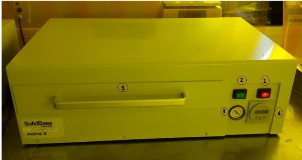
Gambar : Mesin Aktina S